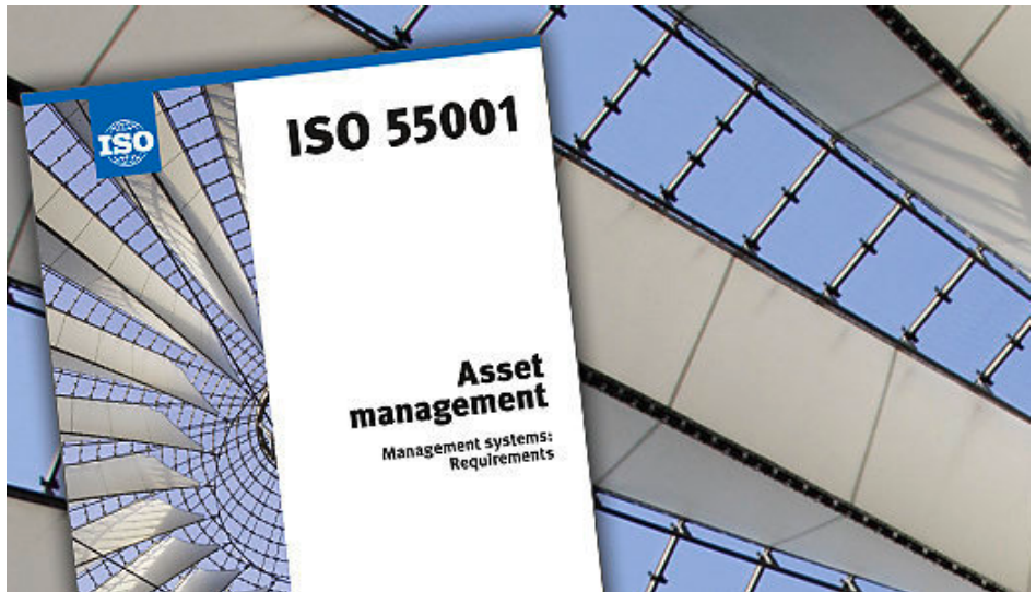
Útgáfa ISO 55001 markaði tímamót í heimi eignastjórnunar.

Eignastjórnun er skilgreind í ISO 55000 sem „samræmd starfsemi innan skipulagsheildar til að skapa verðmæti með eignum“ og spannar ferlið frá því ákveðið er að afla búnaðar og þangað til búnaður er tekin úr rekstri. Staðallinn tekur, sem sagt, til allra þátta þar á milli.