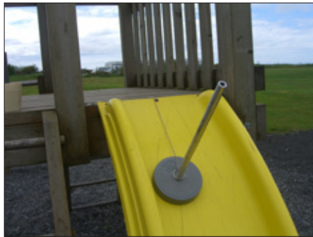
Dæmi um hengingarhættu þar sem reimar á úlpu geta fests í leiktæki.

Leiksvæði er skilgreint í reglugerðinni sem svæði, hvort sem er innan dyra eða utan, skipulagt fyrir leik barna svo sem í eða við leikskóla, skóla, gæsluvelli og opin leiksvæði. Einnig leiksvæði annarra aðila sem börn eiga greiðan aðgang að eða eru ætluð börnum, svo sem í eða við fjöleignarhús, frístundahús, tjaldsvæði, verslunarhúsnaði og samkomustaði.