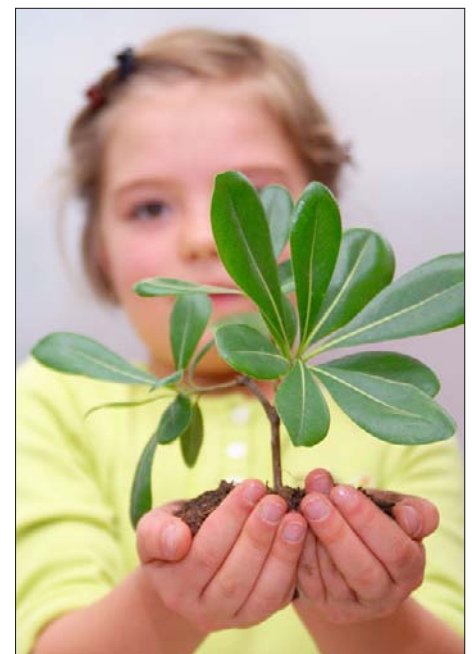
Staðlar auðvelda fyrirtækjum að vaxa

Ofangreind ráðstefna er þáttur í verkefni sem gengur út á að finna leiðir til að efla hag lítilla og meðalstórra fyrirtækja með aukinni notkun staðla innan þeirra og þátttöku í staðlasamstarfi.