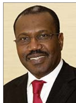
Hamadoun Touré, framkvæmdastjóri Alþjóðlegu fjarskipta-samtakanna ITU.

áreiðanleika, samvirkni, skilvirkni og árangur. Þessu koma staðlar til leiðar á sama tíma og framleiðendur geta treyst því að ná inn á alþjóðlega markaði, vissir um að vörur þeirra virki um allan heim.