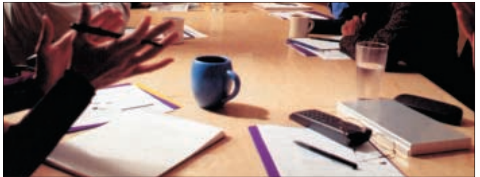
Þátttaka í staðlasamstarfi gerir Íslendingum mögulegt að hafa áhrif á útfærslu Evróputilskipana.

Það eru hagsmunir íslenskra stjórnvalda að stuðla að öflugri þátttöku landsins í evrópsku staðlasamstarfi. Íslendingar eru fullgildir aðilar að staðlasamstarfinu og þar liggur greið leið til að hafa áhrif á útfærslu evrópskra tilskipana sem skylda er að innleiða í íslenska löggjöf. Með því að nota Nýju aðferðina við innlent löggjafarstarf og útgáfu reglugerða gerir stjórnsýslan sér jafnframt auðveldara fyrir og getur bætt gæði starfs síns til muna.