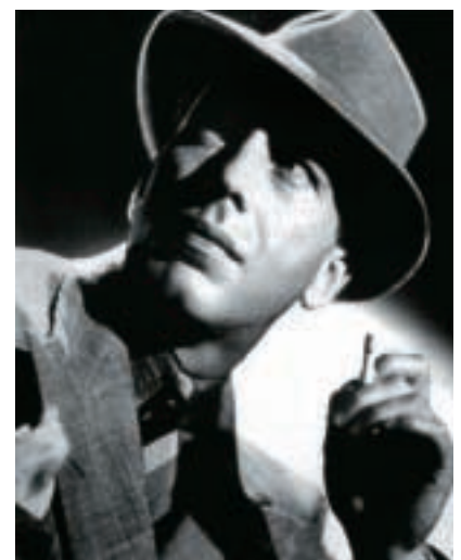
Lykt af sígarettureyk er eftir atvökum góð eða vond, en hún er mælanleg

Hér er ekki verið að mæla hvort lykt sé góð eða vond. Aðferðin er notuð til að mæla hversu mikil eða lítil tiltekin lykt er.