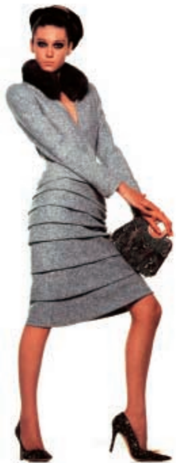
Skyldi þetta vera dragt við astma?

Staðlaráð Íslands óskar systursamtökum sínum í Bretlandi, British Standards, til hamingju með afmælið.