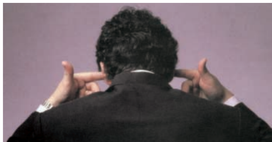
Það getur orðið stjórnendum dýrkeypt að hlusta ekki á kröfur tímans. Þessi ætti heldur að seilast með fingrunum eftir eintaki af ISO 14000 staðlaröðinni.

Kröfur til fyrirtækja um bætta frammistöðu í umhverfismálum hafa klárlega aukist. Oftar en ekki eru starfsleyfi og viðskiptavild þeirra háð því að þau uppfylli tilteknar kröfur um stjórnun umhverfismála og dragi úr áhrifum rekstrarins á umhverfið eins og kostur er. Staðlaröðin ISO 14000 fjallar einmitt um stjórnun umhverfismála í fyrirtækjum. Kröfunum svipar um margt til krafna sem eru til-